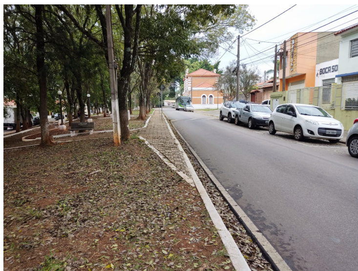
RUA JOÃO PESSOA